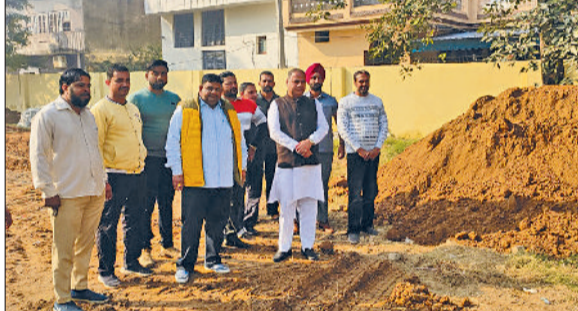
मुलाना। खेल मैदान में निरीक्षण के दौरान का दृश्य।

राजकीय वरिष्ठ माध्यमिक विद्यालय का खेल मैदान अब आधुनिक रूप लेने जा रहा है। बाकायदा इस को लेकर कार्य भी शुरू हो चुका है। बता दें कि यहां लंबे समय से उपेक्षित पड़े इस मैदान के सुधार की मांग की जा रही थी। अब खेल मैदान के सुधारीकरण की जिम्मेदारी ग्राम पंचायत ने अपने हाथों में लेते हुए इसके सुधार के लिए व्यापक योजना तैयार कर ली है। पंचायत