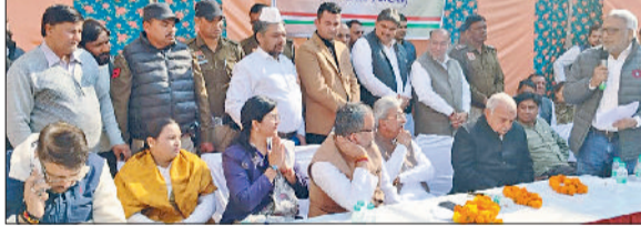
अंबाला। कांग्रेस भवन में मंचासीन कांग्रेसी नेता व कार्यकर्ता।