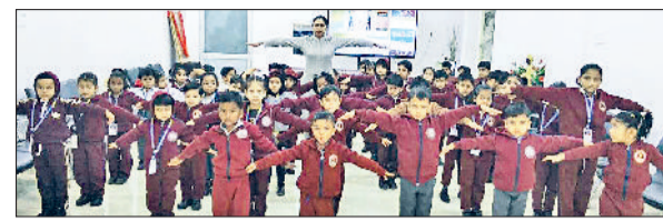
पानीपत। शारीरिक गतिविधियों से अक्षरों की पहचान सीखते नन्हें बच्चे।