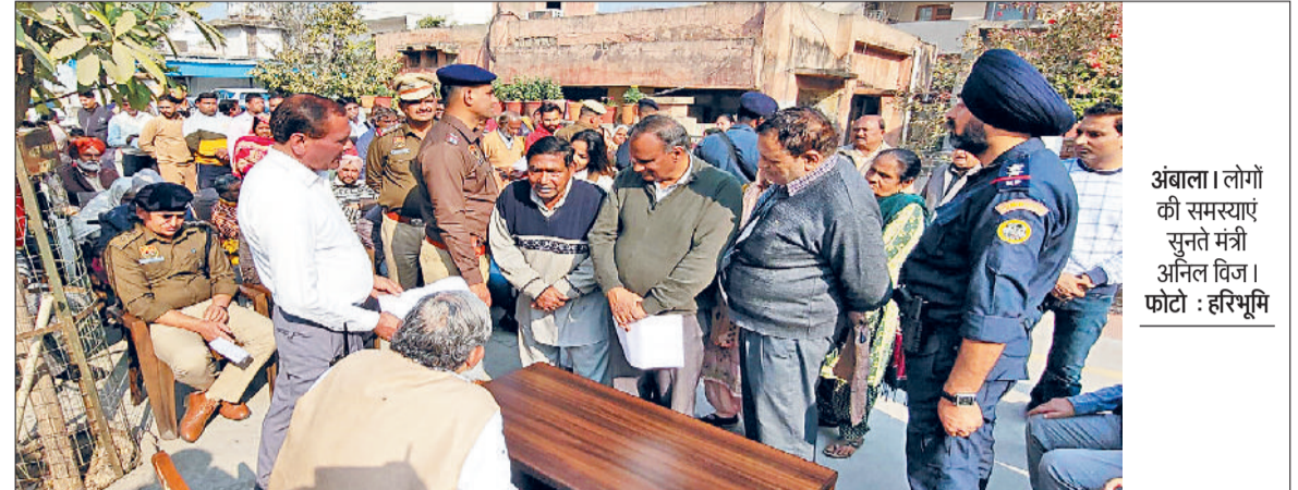
अंबाला। लोगों की समस्याएं सुनते मंत्री अनिल विज।

खेलो इंडिया में कांस्य पदक जीतने वाली महिला मुक्केबाज को विज ने मेडल पहनाते हुए प्रोत्साहन स्वरूप 11 हजार रुपये दिए